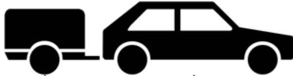
PKW mit Anhänger